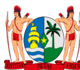
Brasão de armas